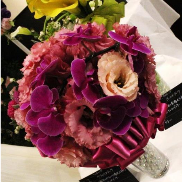
【阿武隈トルコキキョウ】