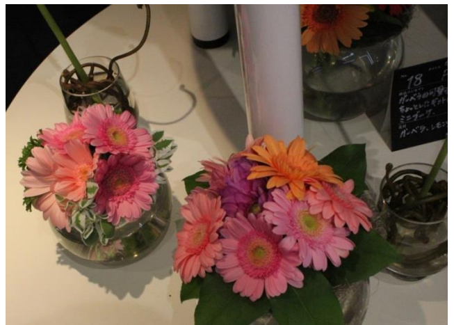
【3県の産地の切り花を使用したギフト商品 -ブーケー-】