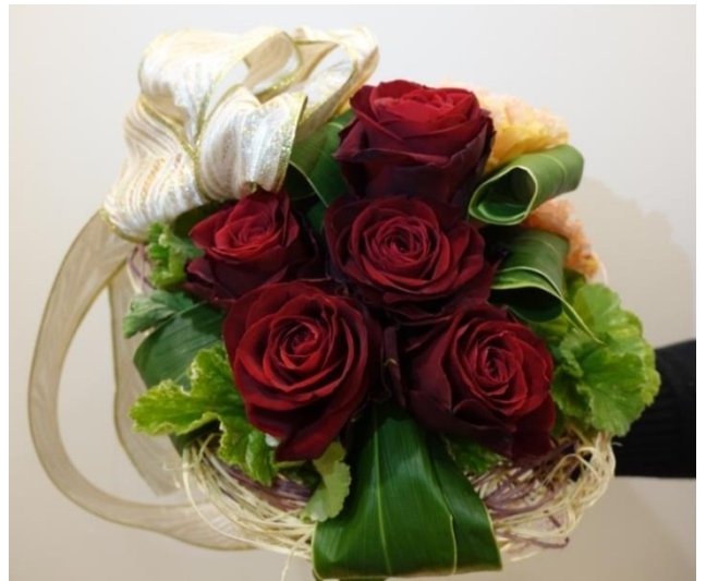
【フレームを使用したブーケ】 4種

大きなリボンをあしらったり、モチーフを使用したりとフレームブーケは簡単に少量の花でデザインに変化をつける事ができます。