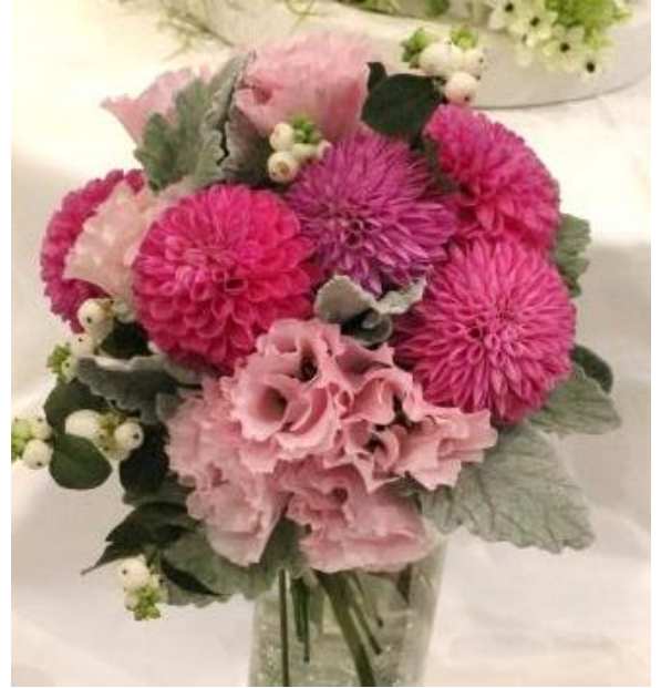
【阿武隈トルコキキョウ】