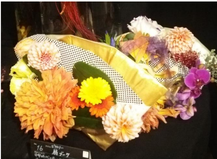
【扇型ブーケ】 扇子の形状は、「末広がり」に通ずるので縁起の良い物とされています。 お目出度い席で用いられる事が多い為、 オリンピック勝者に与えられるブーケには縁起物の扇子をモチーフにデザインしました。