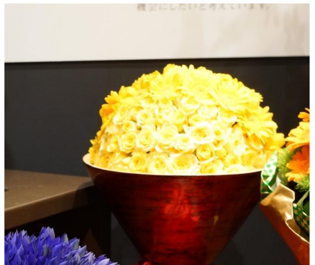
【石巻ガーベラ・スプレーバラ】