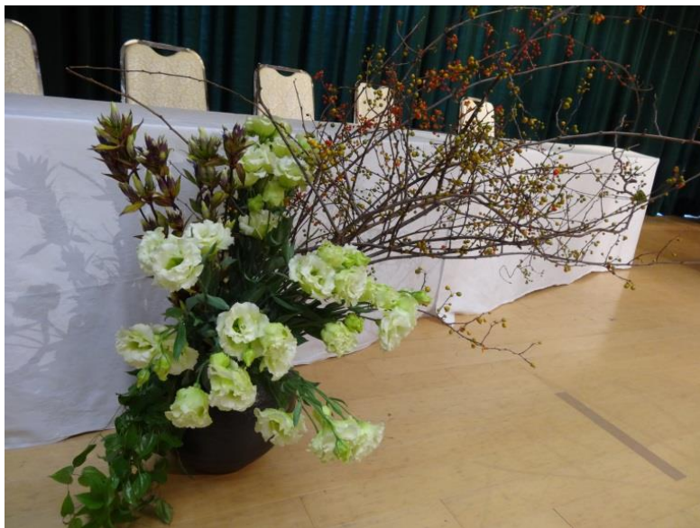
リンドウとツルウメモドキ、ユリの舞台装飾

地産池消で考えられたデザインです。東北には高品質な上質な花きが生産されています。