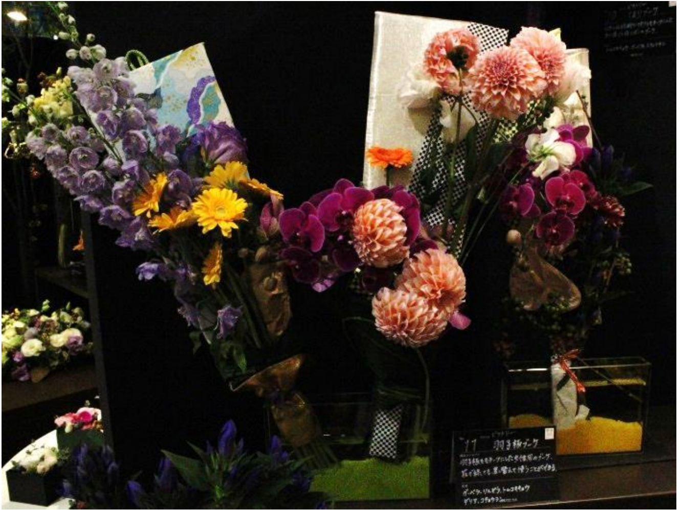
【羽子板型ブーケ】 東京の伝統工芸品に指定されている 羽子板をモチーフにしたブーケ