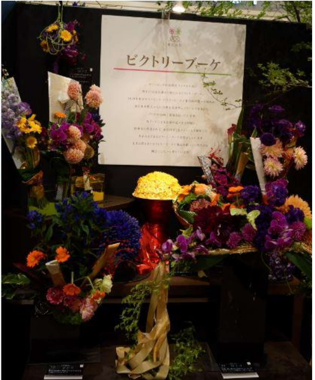
【東北フラワーフェス ビクトリーブーケ展示コーナー】