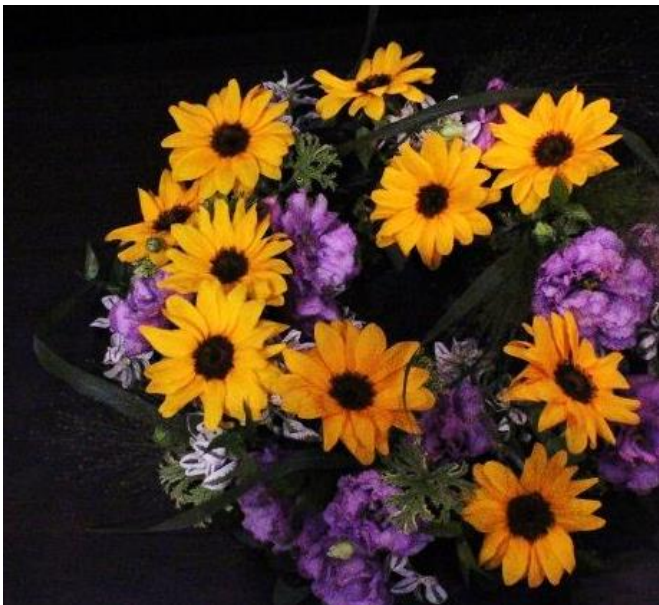
【阿武隈トルコキキョウ】

トルコキキョウをメインに制作したリースです。小ぶりのヒマワリと大輪で八重咲きのトルコキキョウを使用しています。トルコキキョウの立派な花姿が目を楽しめます。