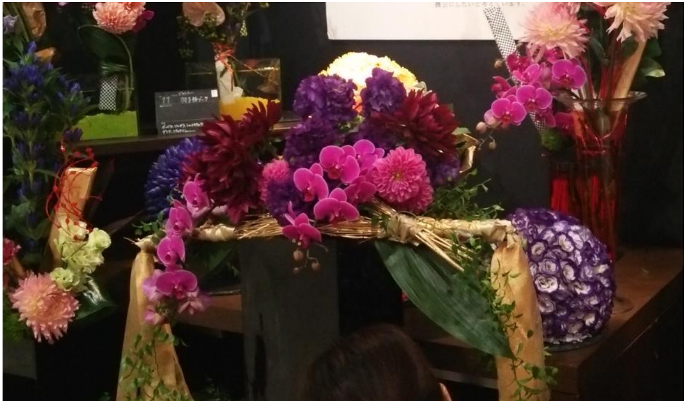
半月型の大型ブーケ

制作花材は形と大きさに相応しい八重咲のフリンジのトルコキキョウや胡蝶蘭、大輪のダリアで華やかに仕上げました。