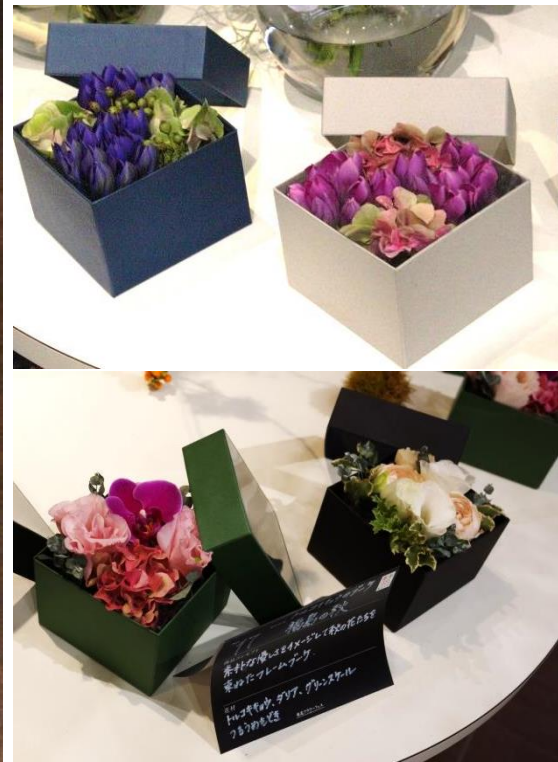
【3県の産地の切り花を使用したギフト商品 -BOX型-】